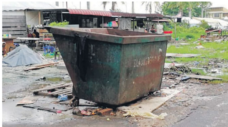
Kutipan sampah dilaksanakan KDEB Waste Management Sdn Bhd bermula 1 November lalu.