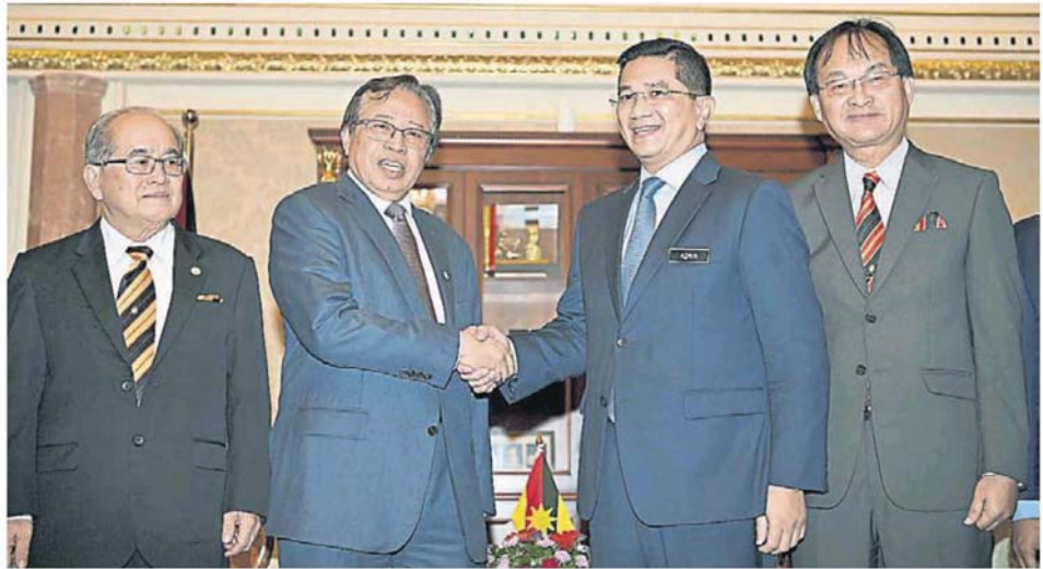
阿兹敏与阿邦佐哈里握手问好。左为砂州副首长拿督阿玛道格拉斯，右为工程部长巴鲁比安。

此外，他欢迎州政府设立咨询委员会，以确保沙巴及砂州有足够代表讨论及检讨 1963 年马来西亚协议。