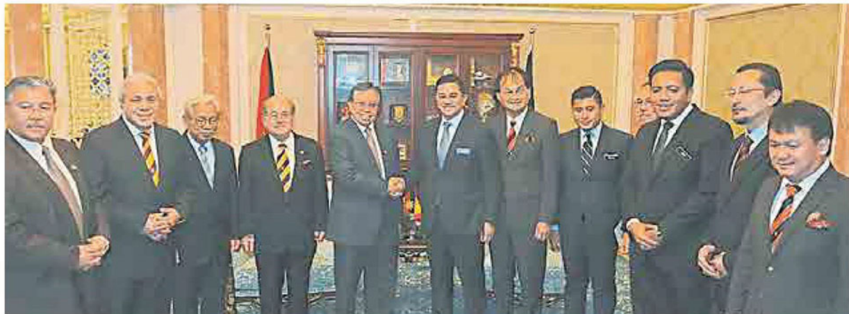
大马经济事务部长拿督斯里阿兹敏阿里（右）拜会首长阿邦佐哈里（左）时摄。

（本报古晋7日讯）基于公共工程局有良好的施工措施，而该局也有经验丰富的建筑专家，因此，大马经济事务部长拿督斯里阿兹敏阿里建议砂拉越残旧学校修建工程应该予砂公共工程局负责承建，确保这些工程可以在预期内完工。