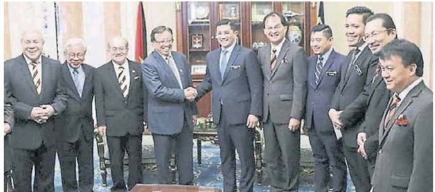
■阿兹敏（右6）在巴鲁比安（右5）陪同下，礼貌拜会砂首长阿邦佐哈里（左4）与众内阁。

他说，其他两名部长即经济事务部长拿督斯里阿兹敏阿里和房屋与地方政府部长祖莱达，都曾到访该州。