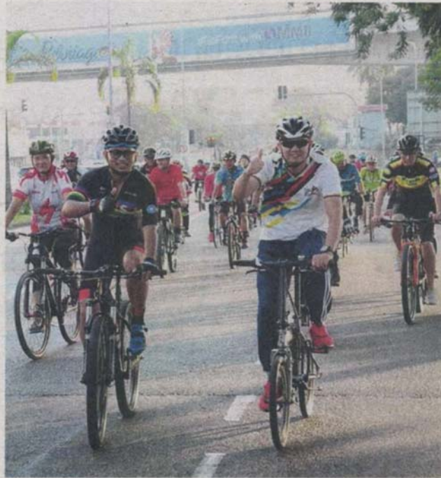
SEBAHAGIAN peserta yang menyertai program Jom Sihat dan Lestari @MPSJ di Subang Jaya baru-baru ini.

Objektif pengajuran program itu antara lain untuk menggalakkan amalan gaya hidup sihat, melaksanakan inisiatif-inisiatif ke arah perbandaran rendah karbon dengan pengurangan penggunaan kenderaan persendirian serta menyediakan platform untuk ahli keluarga menjalankan aktiviti riadah.