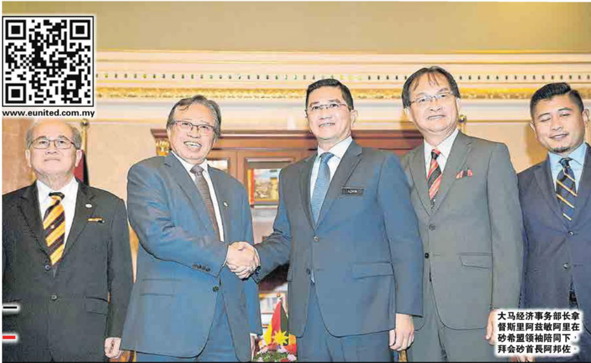
大马经济事务部长拿督斯里阿兹敏阿里在砂希盟领袖陪同下，拜会砂首长阿邦佐。