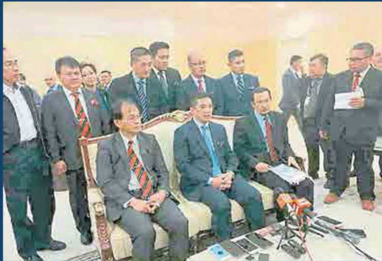
大马经济事务部长拿督斯里阿兹敏阿里召开新闻发布会时摄。