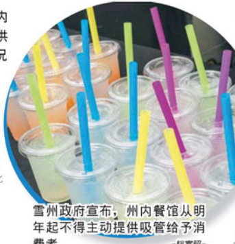
雪州政府宣布，州内餐馆从明年起不得主动提供吸管给予消费者。