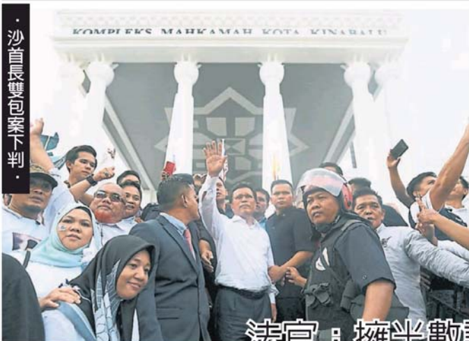
沙首長雙包案下判