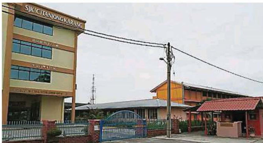
▲福德祠大伯公就坐落在丹絨加弄华小旁。

他披露,州政府目前未作出任何承诺,不过他盼州政府能看在当地民众发扬宗教信仰,且该地段占地不大,希望批准这块地段。