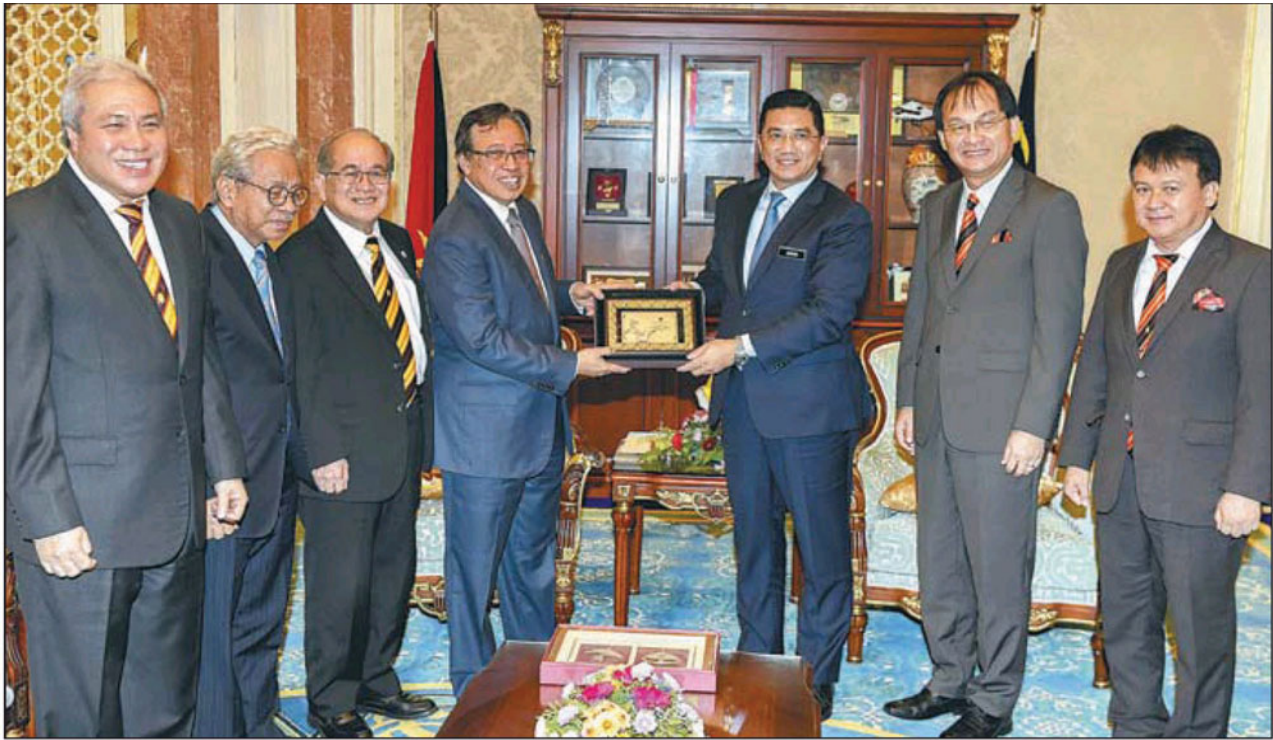
砂洲首长拿督巴丁宜阿邦佐哈里（左4）赠送纪念品予来访的阿兹敏阿里（右3）。左起为副首长拿督阿玛阿旺登雅、副首长丹斯里占玛欣及副首长拿督阿玛道格拉斯。右起为卡连区州议员阿里比朱、联邦工程部长峇鲁比安。