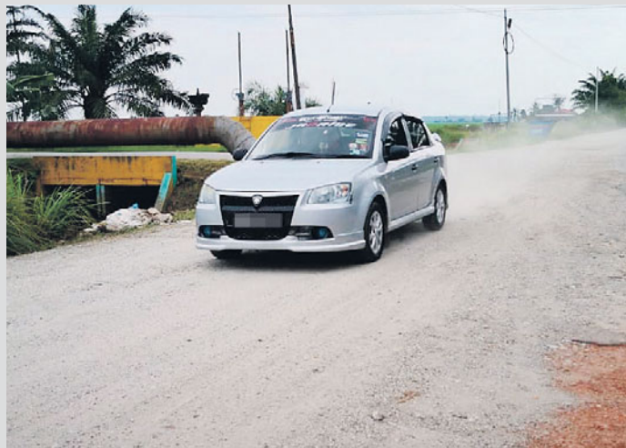
Kontraktor diminta bertanggungjawab sepenuhnya terhadap penyelenggaraan jalan di Parit 9, Pasir Panjang.

"Kontraktor tak boleh lalai dan sambil lewa untuk memastikan segala apa yang dilaksanakan itu